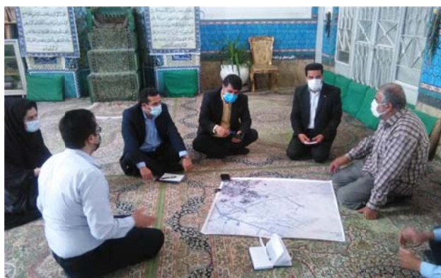
شکل ۲- برگزاری جلسات هماهنگی کارگروه طرح خانه به خانه با نمایندگان محلات حسن آباد و پردیسان