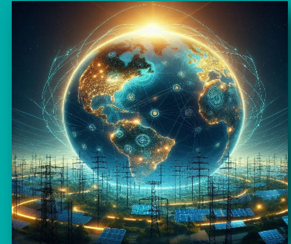
* طراحی تصویر به کمک هوش مصنوعی